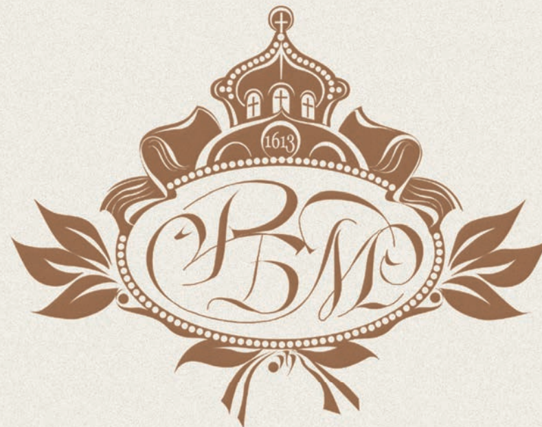
Вариант вензеля (логотипа)

В вензеле соединено в одно изображение начальные буквы названия Раифского Богородицкого монастыря. Простое соединение произведено с помощью вязи между буквами. Для повышения узнаваемости и распознаваемости в социуме используется вместо логотипа.