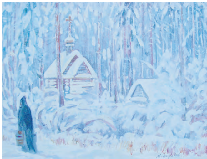
М. Нефедов. Скит, х.т., 2001