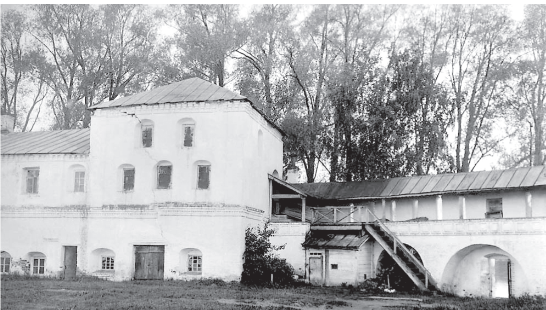
Библиотека. Начало XX века