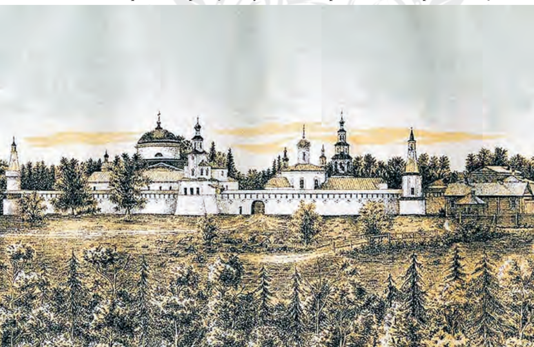
Раифская Богородицкая Пустынь с северо-западной стороны. Конец XIX века