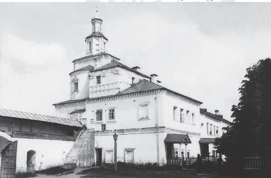
Софийская церковь. Начало XX века