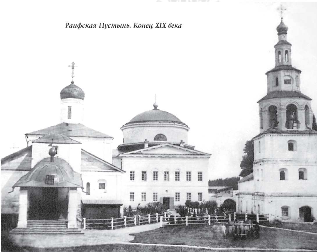
Раифская Пустынь. Конец XIX века