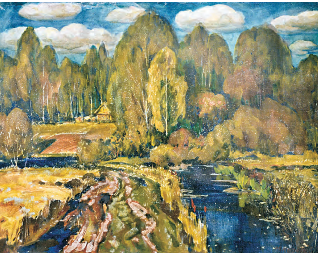
М. Нефедов. Начало листопада., х.м., 1995

русская, когда преобразится душа и полетит на зов, доносящийся из глубин веков земли нашей?