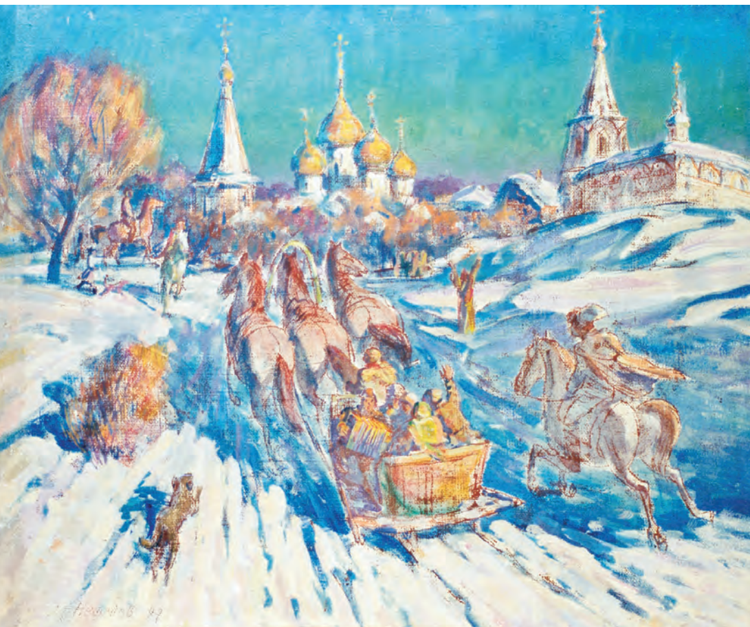
М. Нефедов. Праздник, х.м., 1997