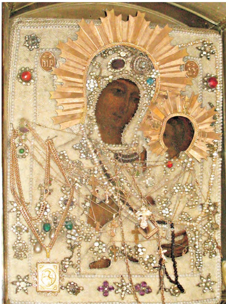
Икона Божией Матери «Грузинская-Раифская».