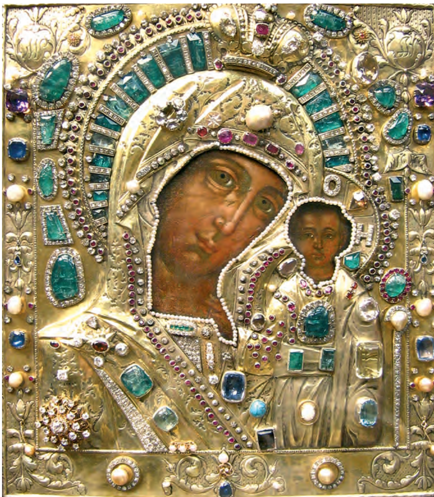
Икона Божией Матери «Казанская», хранящаяся в Крестовоздвиженском храме Казанского Богородицкого монастыря.