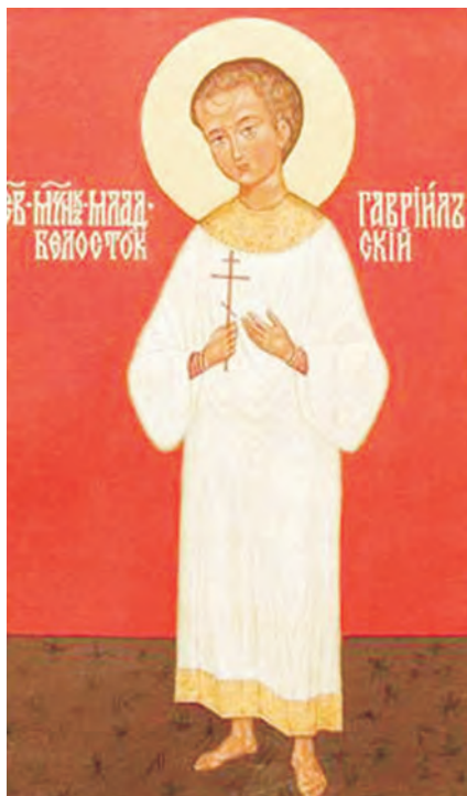
Икона св. Гавриила Белостокского

И я всегда молюсь: Святый мучениче Гаврииле, не оставь нас, грешных.