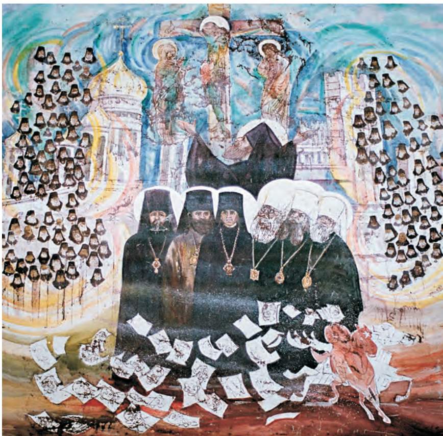
М. Нефедов. Возрождение (Покаяние), х.м., 1998

философии... Объективность — она лежит глубже. И вот художник, естественно, задается вопросом: «Так ли все было на самом деле, как нам преподносили?»