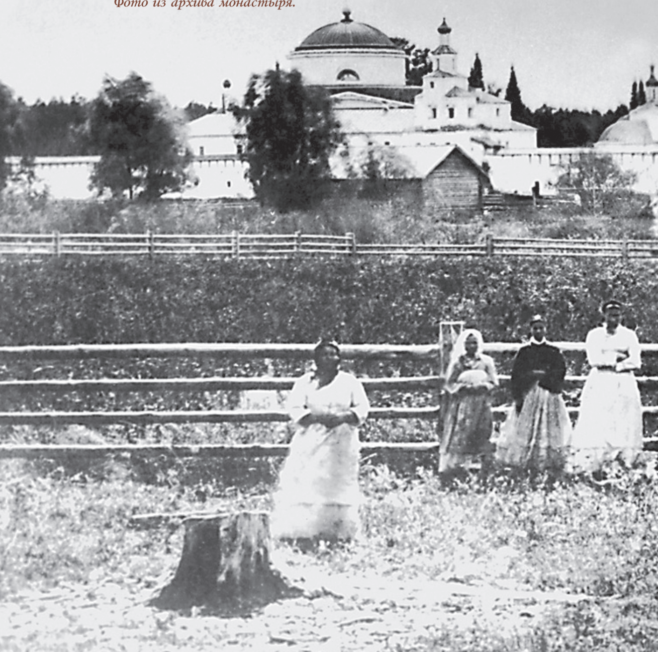
Паломники у стен Раифской обители. 1879 год.