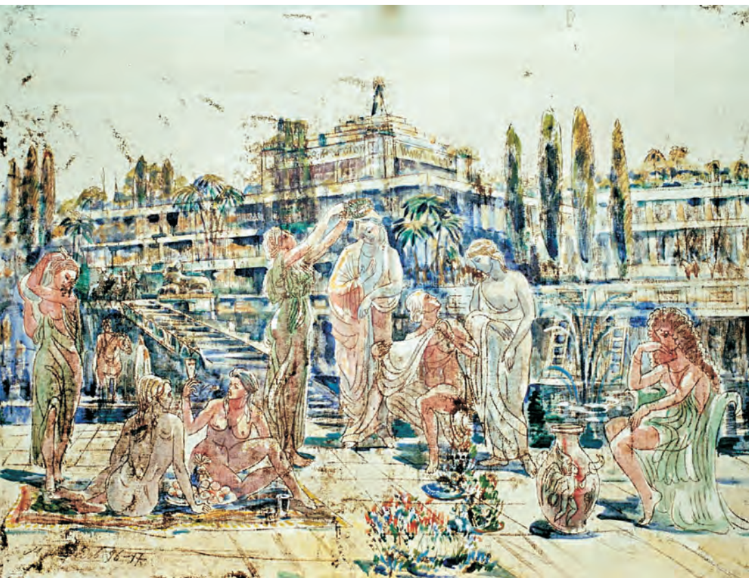
М. Нефедов. Вавилон, х.м., 1997