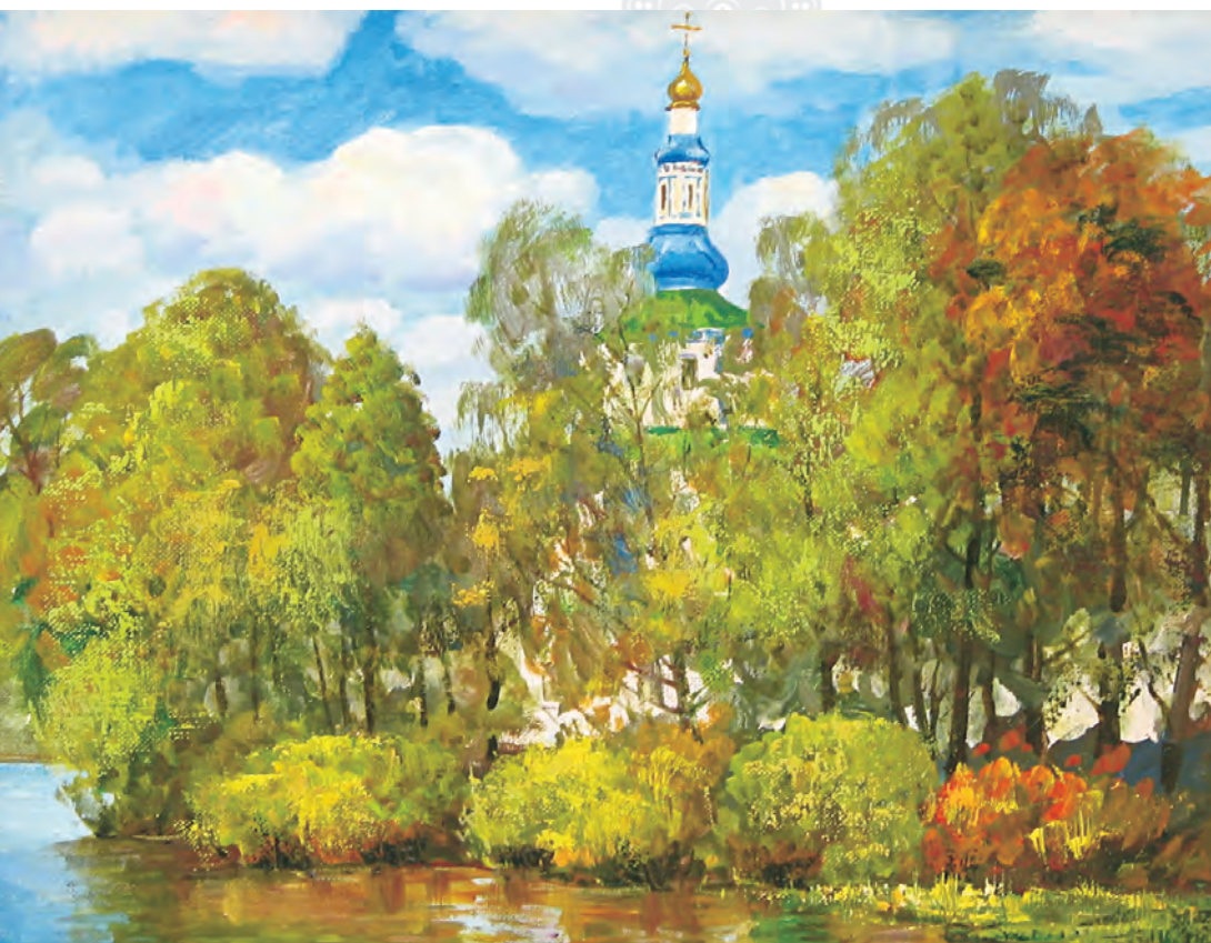
М. Нефедов. Монастырская часовня, х.м., 2010