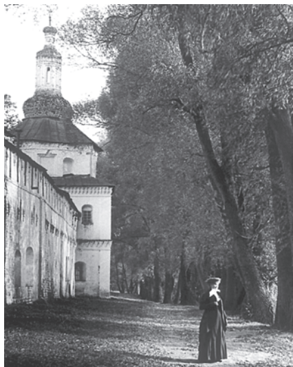
У стен обители. Фото Александра Бренинга, 1912 год.