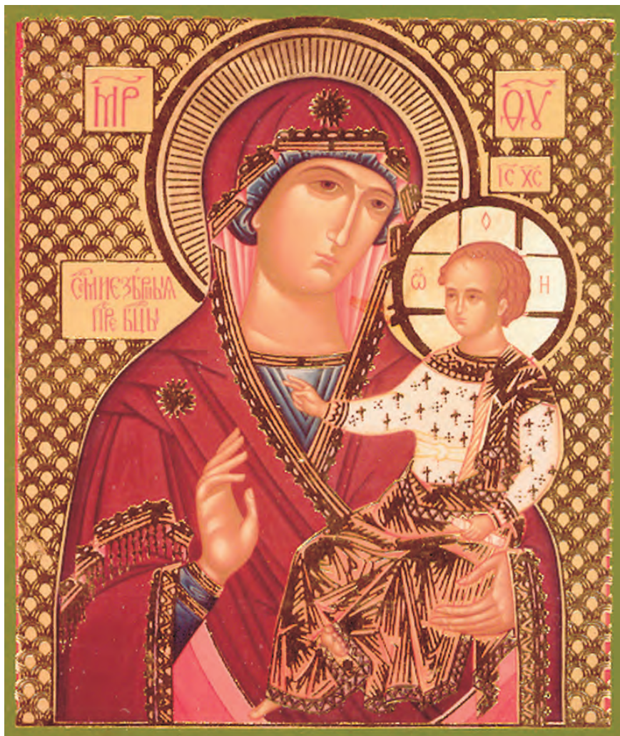
Икона Божией Матери «Седмиезерная».