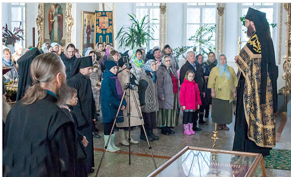
6 марта – Прощеное воскресенье.

■ Нередко говоря «прости» или «прощаю», мы все равно сохраняем в душе горечь обиды или чувствуем свою правоту по отношению к тем людям, которые нам, мягко выражаясь, не нравятся, а иногда причиняют серьезную боль. Где же границы искренности и лицемерия? Если я не люблю человека, не испытываю к нему никаких положительных эмоций, но пытаюсь ему улыбаться — лицемерие это, или нет?