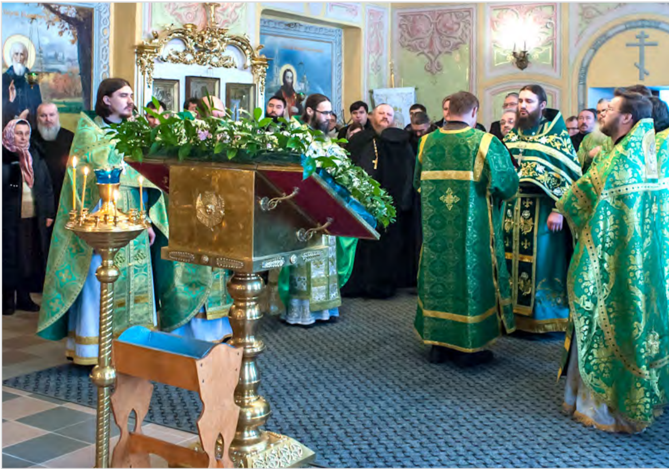
Литургия в храме, освященном в честь Преподобных отцов, в Синае и Раифе избиенных.

Собор постоянно дополняется по мере обнаружения и изучения жития новых новомучеников.