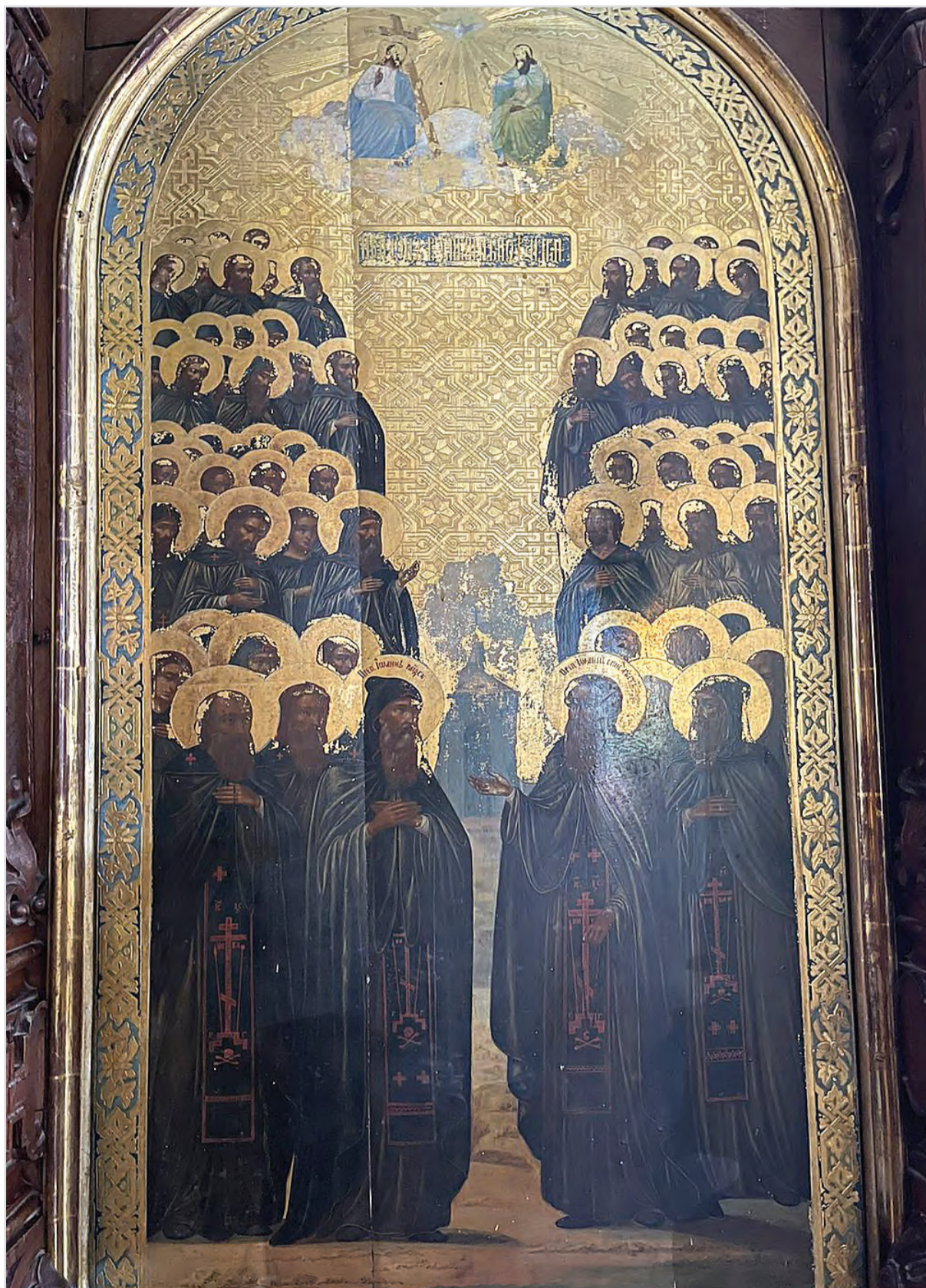
Древняя русская икона мучеников Раифских. Слева — мученики Раифские во главе с игуменом Иоанном Раифским, справа — мученики Синайские во главе с Иоанном Лествичником, игуменом Синайским.