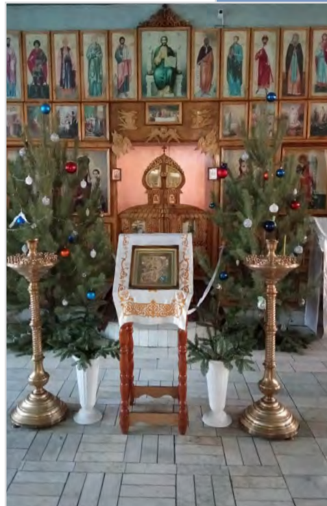
Храм Богоявления, г. Рудный, Казахстан

Митрополит Саратовский и Вольский Лонгин (Корчагин)