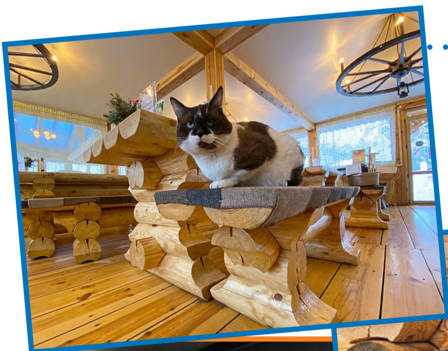
Рисунок Ревинской Ксении