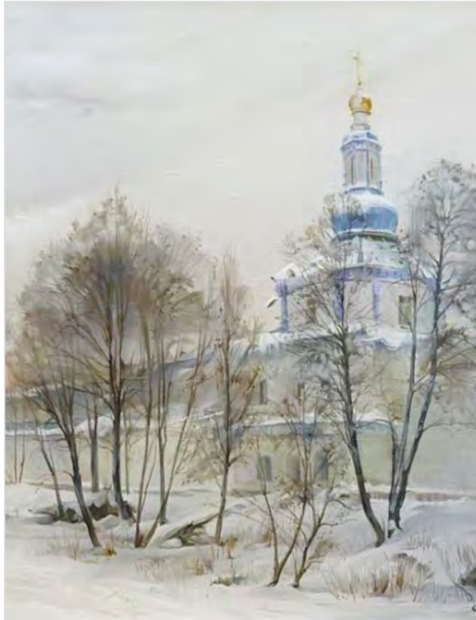
Зимний день в Раифе. Фрагмент. Художник Роман Романов

В ПОДОБНЫХ СЛУЧАЯХ обычно ссылаются на девятую главу Евангелия от Марка, где повествуется о том, как трое апостолов сразу после чуда Преображения, свидетелями которого они были, спускаясь вместе с Учителем с горы Фавор, спрашивают Христа: (Мк. 9, 11-13). Объясняя это место, лукавые «перевоплощенцы» говорят: «Вот видите! — значит, Илия-то пророк воплотился в новое тело! Это его душа переселилась в тело Иоанна Крестителя, о котором Христос говорит, что «Илия пришел, и поступил с ним, как хотели!» Ведь именно Иоанн, называемый Предтечей, пришел перед Христом, проповедовал, а затем был убит».