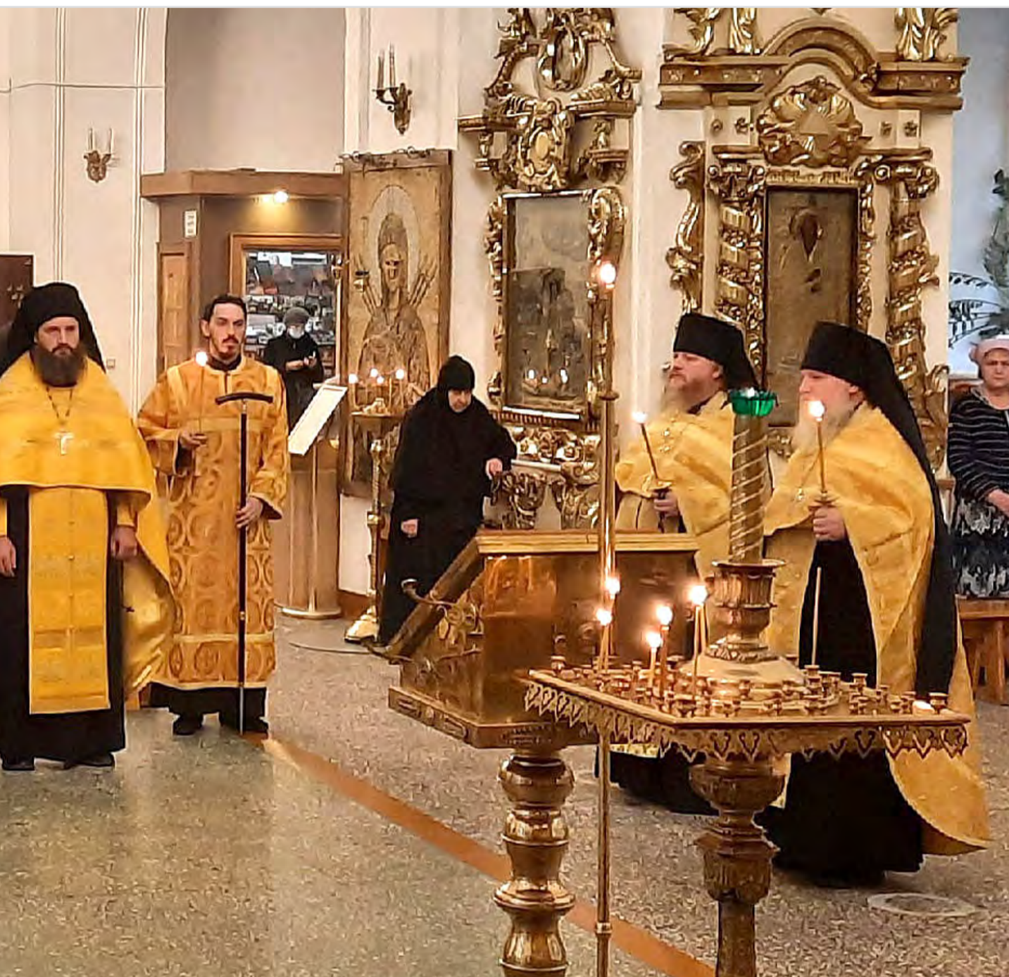
Богослужения и послушания в Раифском монастыре.