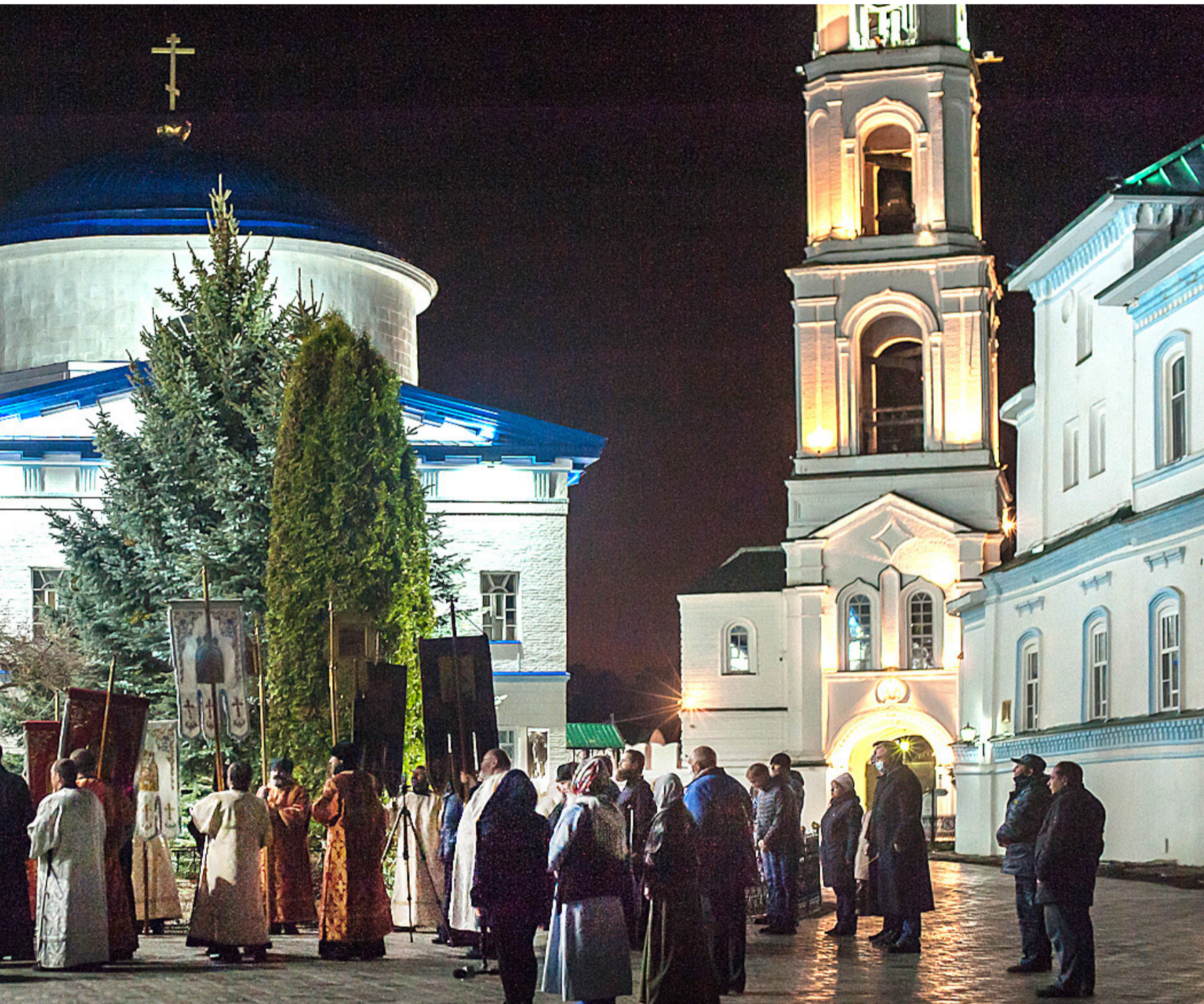
Пасха Господня. Раифа.

«Или думаете ли, что те осьмнадцать человек, на которых упала башня Силоамская и побила их, виновнее были всех, живущих в Иерусалиме? Нет, говорю вам; но, если не покаетесь, все так же погибнете» Лука, 13:1–5