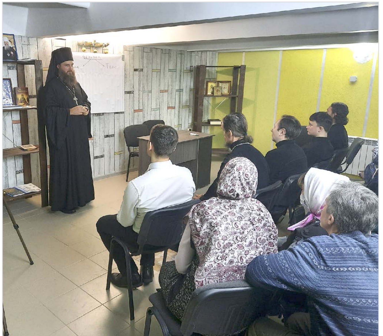
Во время беседы.

Что такое покаяние? Это слово происходит от греческого слова «μετάνοια» («изменение ума»). Нам нужно изменить греховный ум и прийти к Богу. Это внутренняя составляющая поста.