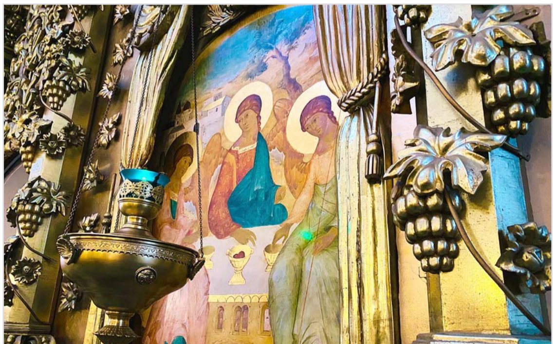
Троица. Раифа.