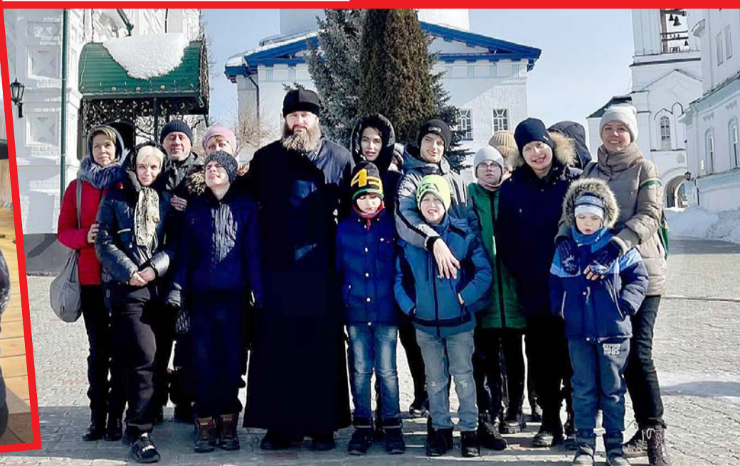
Дети Донбасса в Раифе. Подробности – «Раифский Вестник», стр. 4