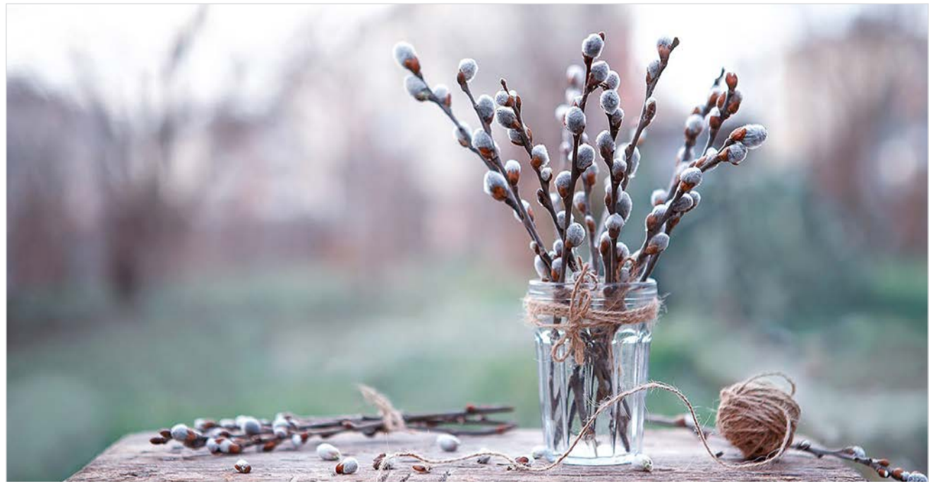
Перед Вербным воскресеньем.

Самый распространенный вид, который встречается повсеместно — это верба белая. Дерево любит влагу и ча-