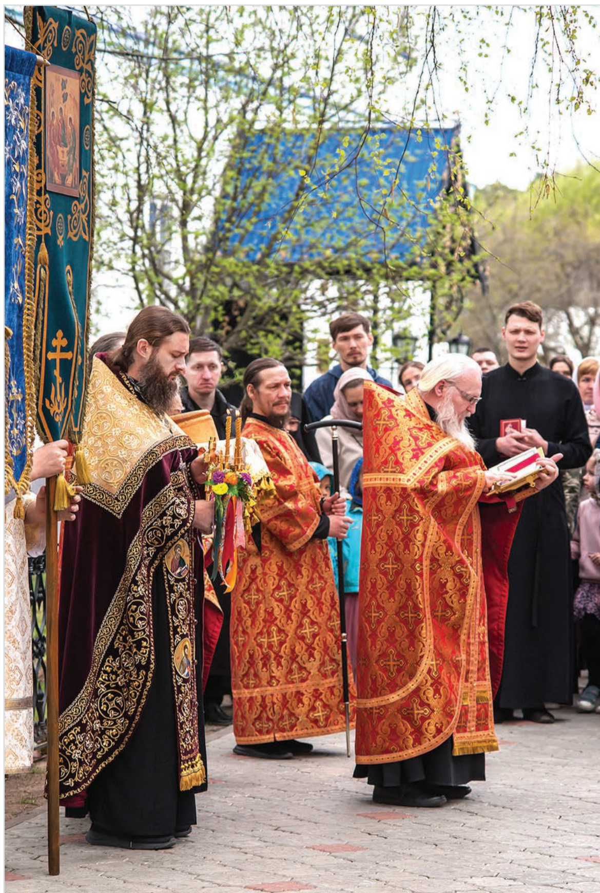
Пасха Господня.