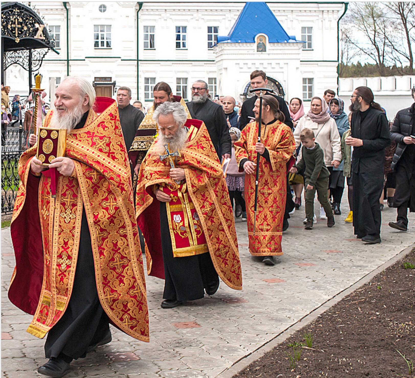
Пасха Господня. Раифа.

Господь нас любит, Он сказал, что «ни в ком нет такой великой любви, как в том, кто готов положить свою жизнь за друзей своих» (Ин. 15,13). Не так уж много людей, готовых совершить это, но Христос положил жизнь за нас, когда мы были противниками, чуждыми Ему. Воскресение Христово — это победа любви, оно говорит нам о том, что любовь, которая принимает смерть, тем самым делает сильнее смерти. Соломон в «Песни песней» сказал: «Крепка как смерть любовь» (Песн. 8, 6). Любовь — это единственная сила, которая может сразиться со смертью и не быть побежденной.