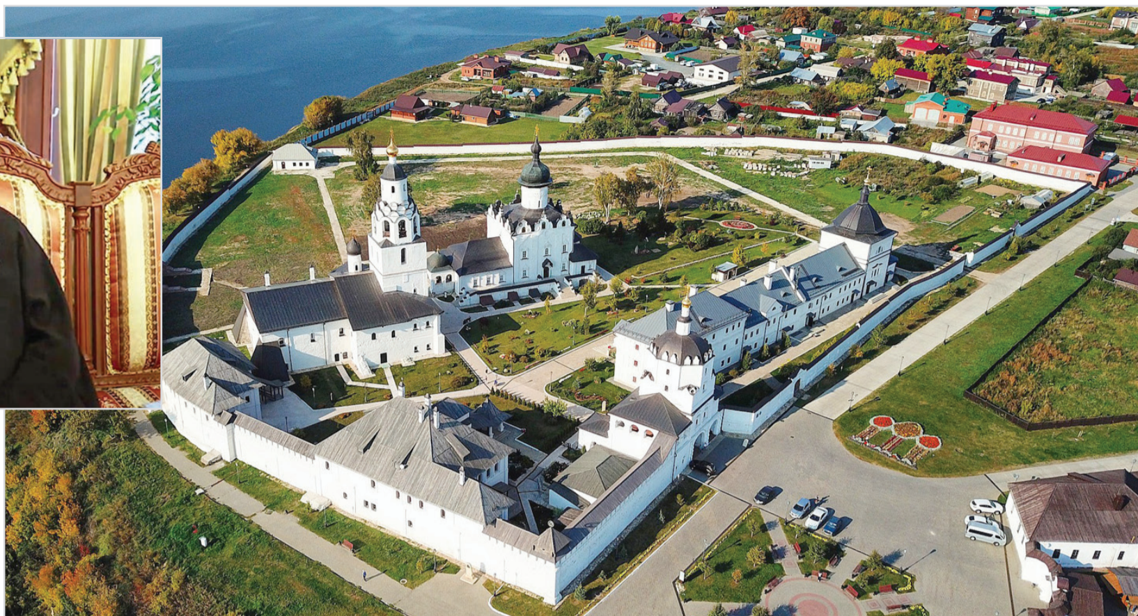
Казанский кафедральный собор Казанско-Богородицкого мужского монастыря.

25 лет Возрождению Свяжского Богородице-Успенского монастыря