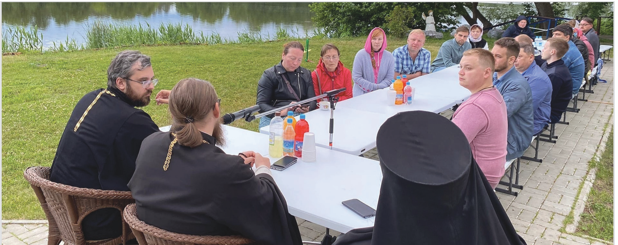
«Духовные беседы» на берегу Раифского заповедного озера.