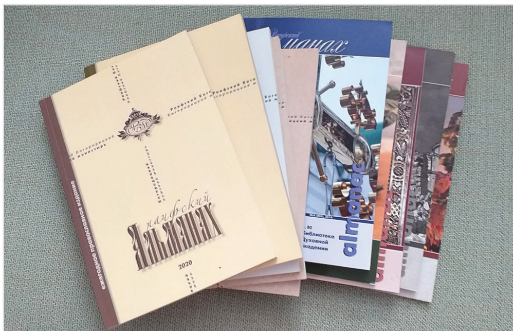
Издание Раифского Богородицкого монастыря