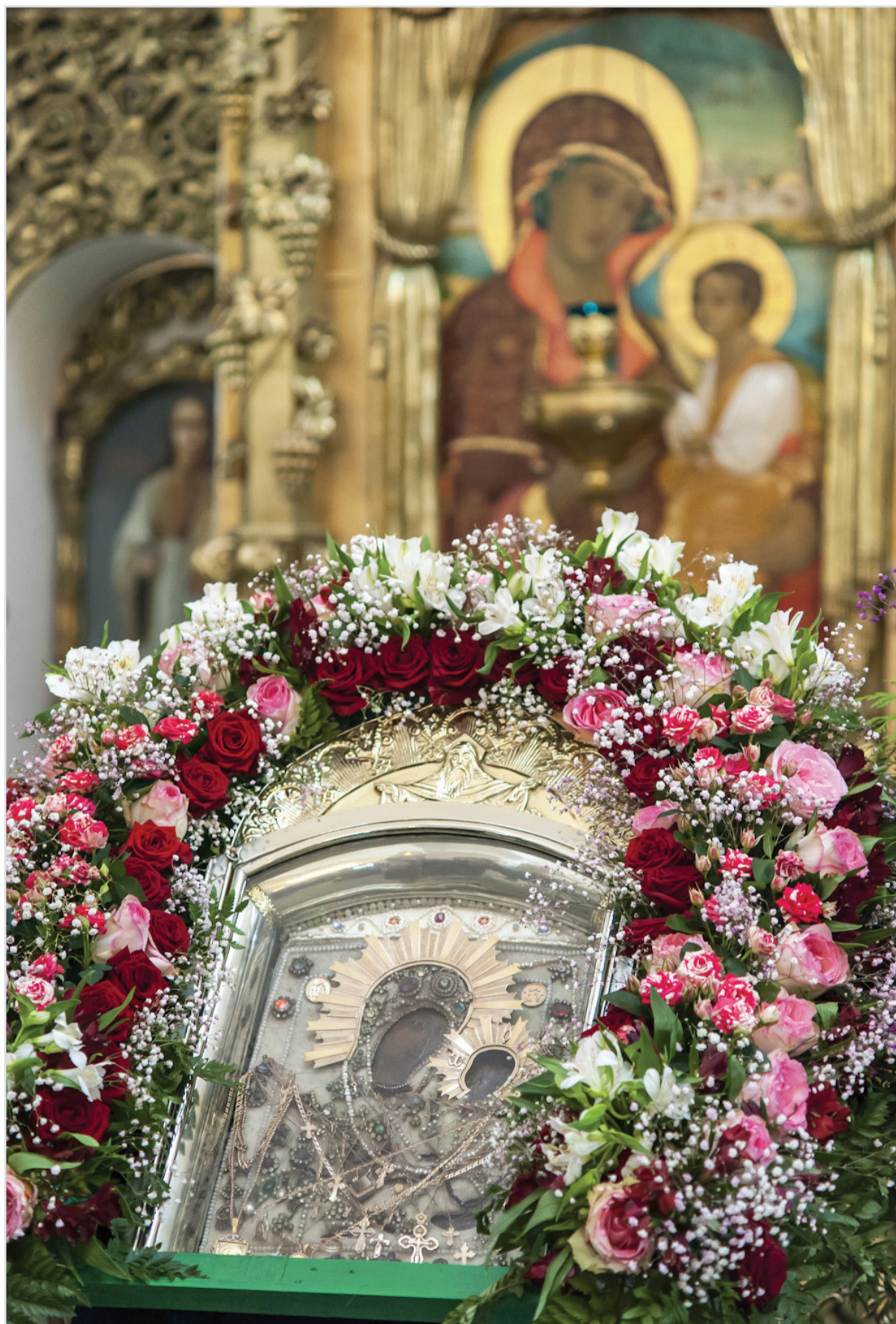
Чудотворная икона Божией Матери «Грузинская (Раифская)»