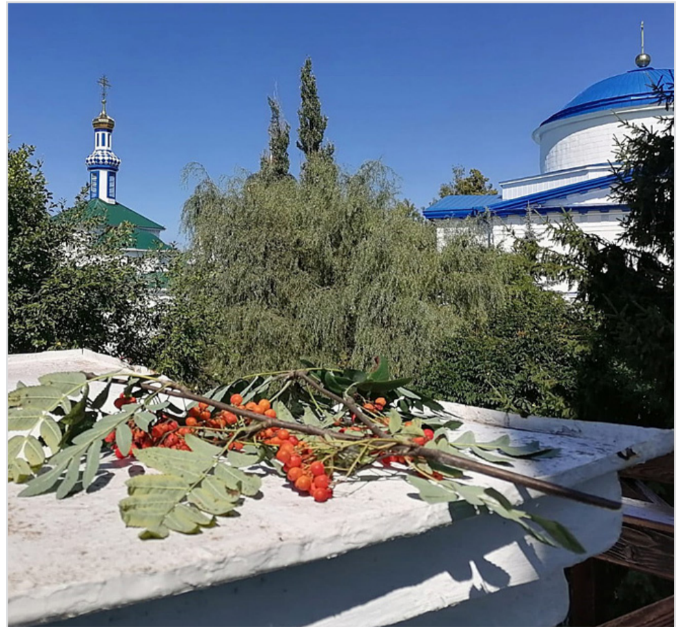
Рябина: в ожидании преображения

выгодно быть добрым. Ведь большинство из птиц и зверей не только поедает плоды, но и способствуют распространению рябины. Прошедшие через пищеварительный тракт дроздов, свиристелей и других любителей цельных ягод, семена рябины не теряют всхожести, разносятся в разные стороны и дают жизнь новым деревьям. Помогают рас-