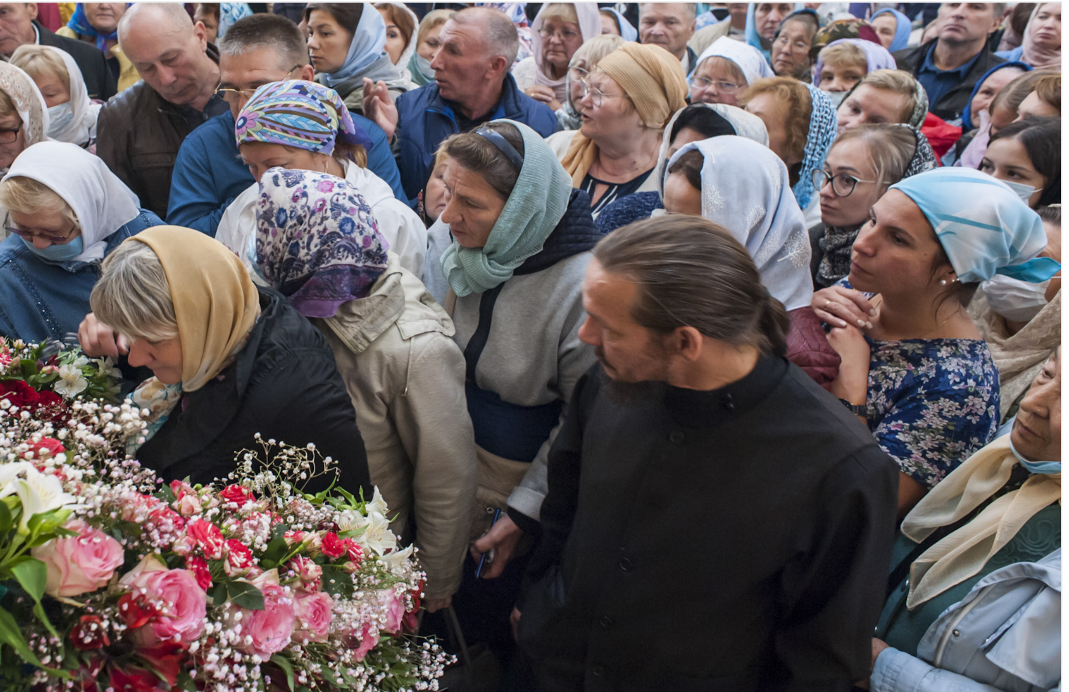
«Избранней от всех родов Божией Матери и Царице пред пречистым Ея образом со умилением хвалебная пения приносим...»