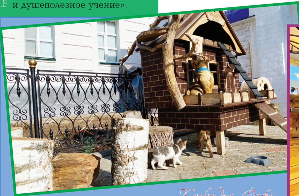
Коткин дом. Раифа

— Правильно говоришь малыш! Кто воспитывает, кормит и заботится о малыше тот и есть для него настоящая мама. А там, где малышу сытно, тепло и спокойно там и есть его дом и семья.