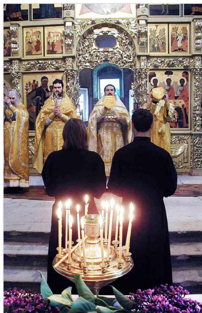
Свяжский Богородице-Успенский монастырь. Май 2002 года.